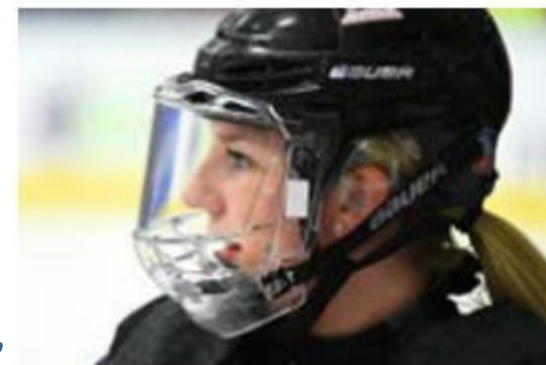
Полная лицевая маска

viii. Хоккеист, у которого во время игровых действий треснул или сломался козырек, полная пластмассовая маска, или решетчатая маска, должен немедленно покинуть лед.